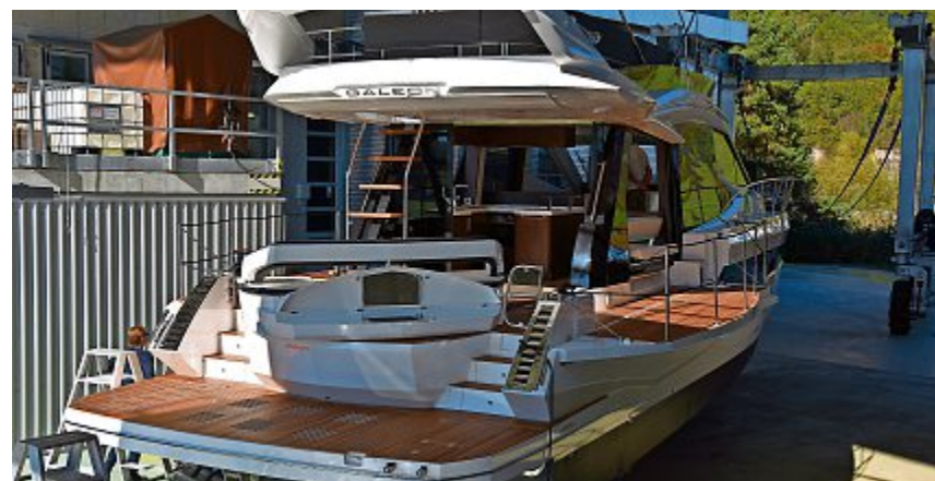
Attraktion der Show war die Yacht Galeon 500 Flybridge.