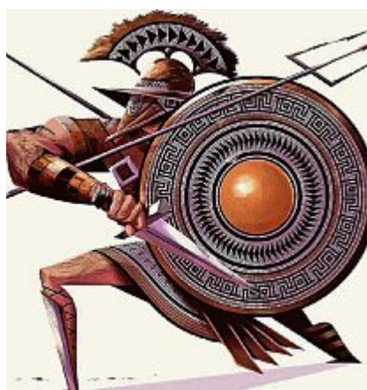
Werk von Amadeus Waltenspühl.