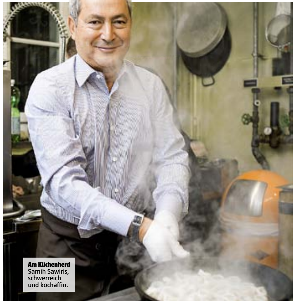
Am Küchenherd Samih Sawiris, schwerreich und kochaffin.

« Unter diesen Umständen ist es nicht angezeigt, dass der Kanton Zürich eine Kreditvorlage ausarbeitet, die den Bund entlastet und kantonalen Finanzen über Jahre stark belastet», schreibt der Regierungsrat. Die eidgenössische Volksabstimmung zur Vorlage FABI werde laut dem Bundesamt für Verkehr im Frühjahr 2014 stattfinden. Zuvor wird der Nationalrat in der Sommersession noch darüber diskutieren. as