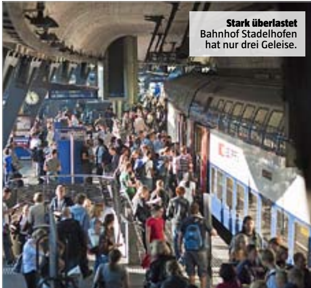
Stark überlastet Bahnhof Stadelhofen hat nur drei Geleise.

NEIN → Der Bahnhof Stadelhofen platzt aus allen Nähten. Ein viertes Gleis muss her. Wer kommt dafür auf? Der Kanton nicht.