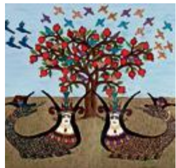
«Symbole des Lebens» bis Sonntag im Kulturparkett Kemprieten in Rapperswil. Eti Koen